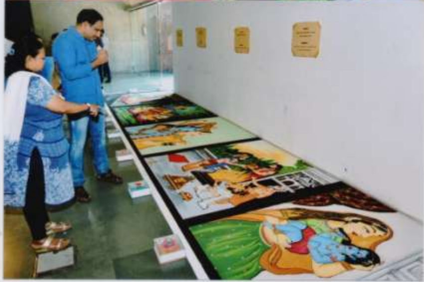
સભ્યવલ્લ સંયોગી પ્રદર્શનનું ઉદ્ઘાટન તથા પ્રદર્શન દિવાળયા મા. પંચરાશી, અ-વ મહાનુભાવો તેમજ મ્યુનિસિપલ કમિશનરશ્રી.