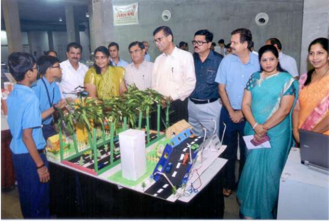
सायन्स सेन्टर जाले विद्याल मेगानुं उदघाटन करना तथा प्रोजेक्ट निहाणता भा.मेयरश्री तथा अन्य म्दानुभावे